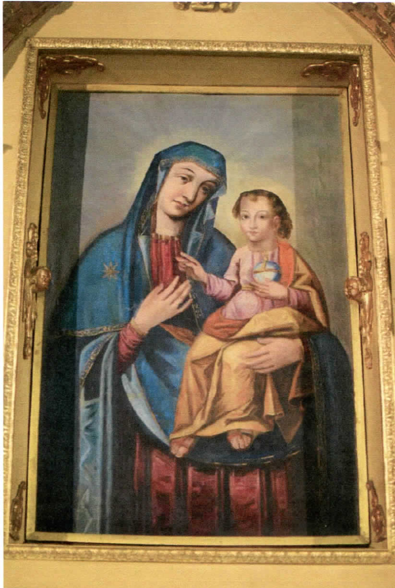
Obraz Matka Boska z Dzieciątkiem

Obraz jest w złym stanie. Płótno faluje, co powoduje pękanie grubej warstwy malarskiej. Widoczne są podnoszące się łuski gruntu wraz zaprawą malarską. Powierzchnia malatury pokryta jest równomierną warstwą brudu, werniks pożółkł. Całość jest przemalowana.